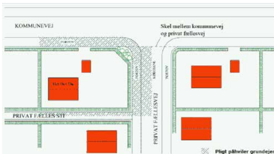
Figur 2, Hjørnegrund med adgang til kommunevej samt grænser til privat fællesvej hhv. -sti. Pligten kan i dette tilfælde pålægges grundejeren for det kommunale fortov. Tilsvarende kan pligten pålægges for den private fællesvej hhv. -sti for den del af vejen/stien, der ligger nærmest ejendommen.