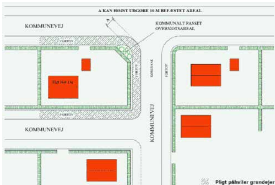
Figur 1, Hjørnegrund grænsende til 3 kommuneveje med fortov. Grundejer kan pålægges pligten på alle sider, da de ligger i ubrudt forlængelse af en adgang til ejendommen.

Illustrationerne er medtaget for at tydeliggøre nogle af principperne i Lov om offentlige veje og Lov om private fællesveje.