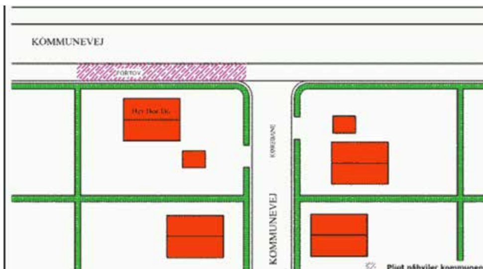
Figur 4. Da grundejerens adgang er til en kommunevej uden fortov, kan pligten for fortovet på vejen uden adgang ikke pålægges grundejeren, da dette ikke ligger i ubrudt forlængelse af en adgang.