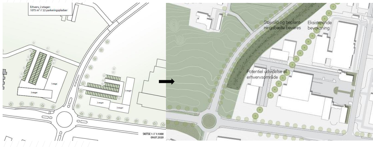
Figur 1.8: Aalborg Kommune foreslår erhverv og dagligvarebutik i den sydøstlige del af området, begge med adgang fra Bejsebakkevej. Dette er blandt andet på bekostning af den eksisterende beplantede støjvold, der skaber en afskærmning mellem Sorthøj og erhvervsområdet mod øst. Nyt erhverv bør udelukkende placeres i tilknytning til det eksisterende erhvervsområde, ligesom detailhandel bør placeres i tilknytning til eksisterende lokalcentre.

Ifølge Kommuneplanens retningslinje 7.1.3 er det hensigten, at butikker, herunder dagligvarebutikker, skal placeres inden for de afgrænsede bydels- og lokalcentre. Enkeltstående dagligvarebutikker kan placeres uden for lokalcentrene, så længe de er placeret mere end 500 meter derfra, og så længe de jf. Kommuneplanen er mindre end 1.000 kvm. Den foreslåede dagligvarebutik på 1.200 kvm er således i modstrid med kommuneplanens retningslinjer.