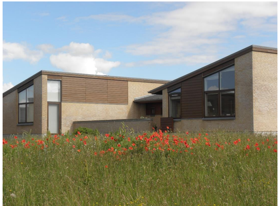
Figur 1.6: Den grønne kile driftes i dag efter en samlet plan, der følger Aalborg Kommunes strategi om mere natur i byen. Dette kan med fordel udbredes endnu mere i området.

Området kan dog med fordel planlægges med endnu større diversitet, end det er tilfældet i dag, og således blive et markant eksempelprojekt for udbredelse af Kommunens biodiversitetsstrategi.