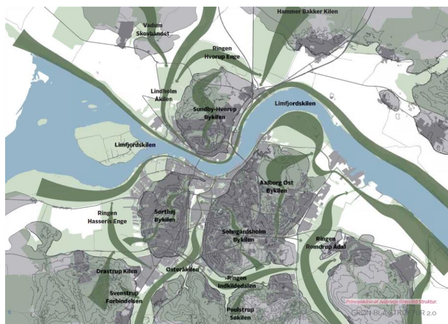
Figur 1.2: Sorthøj bykilen indgår som en del af Aalborg Kommunes Grøn-blå struktur, hvor den skaber en rekreativ forbindelse mellem Aalborg Midtby og det åbne land mod sydvest.

Grøn-blå struktur er Aalborg Kommunes strategi for landskabelige interesser i og omkring Aalborg By.