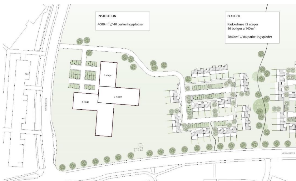
Figur 1.10: En ny daginstitution over for Hasseris Gymnasium vil medføre en øget trafikbelastning i et område der allerede er hårdt trafikalt belastet.

Det anses derfor ikke som en trafikal mulighed at placere en institution i området, ligesom det også er i modstrid med områdets øvrige anvendelse til boligformål.