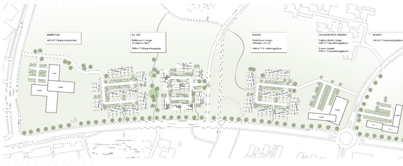
Figur1.1: Aalborg Kommune foreslår en ny randbebyggelse langs Skelagervej med både boliger, erhverv, dagligvarebutik og institution

Grundejerforeningerne mener grundlæggende, at Sorthøj er fuldt udbygget.