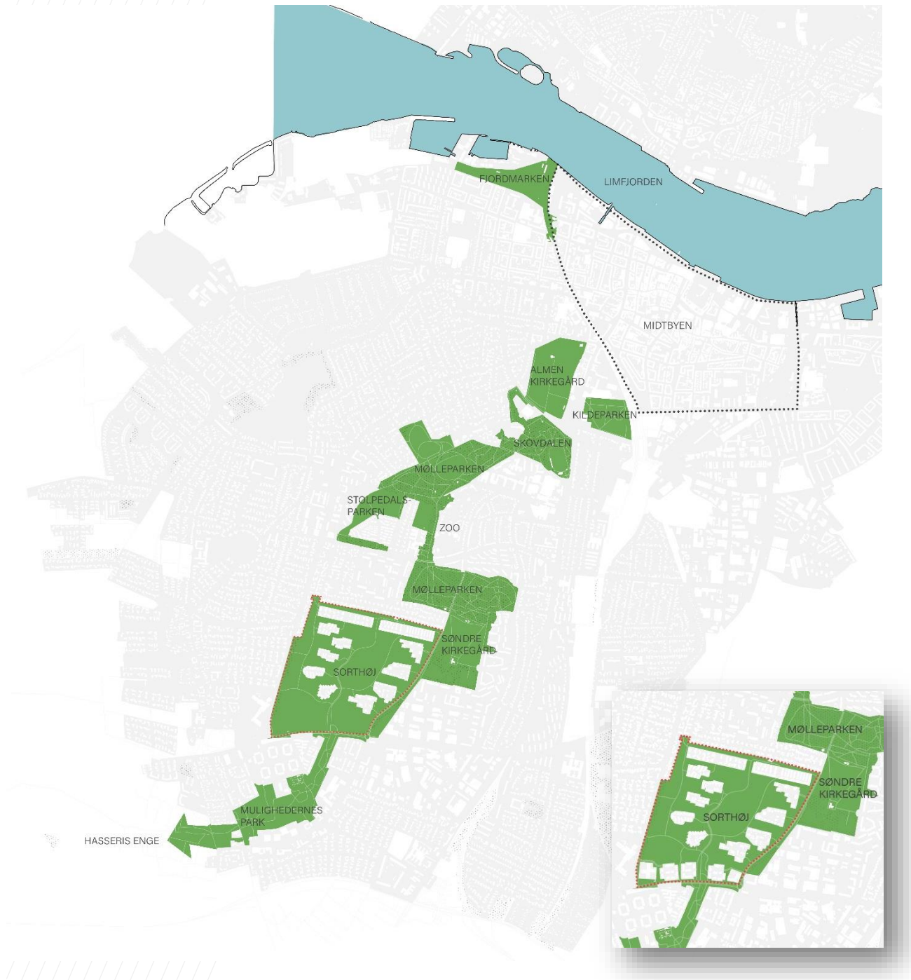
Figur1.3: Sorthøj indgår som en væsentlig del af den sammenhængende grønne bykile, der skaber forbindelse mellem Aalborg Midtby og det åbne land mod sydvest. Området er velbesøgt af bydelens borgere, og et vigtigt nærrekrativt område. Ved en byfortætning langs Skelagervej, som Aalborg Kommune foreslår, vil den grønne kile indskrænkes væsentligt, og de nærrekrative områder i bydelen vil forringes.