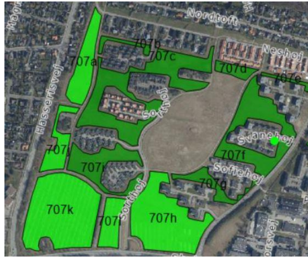
Figur 1.5: Sorthøjs grønne områder driftes af Aalborg Kommune efter biodiversitetsstrategien "Rig Natur"

Området kan dog med fordel planlægges med endnu større diversitet, end det er tilfældet i dag, og således blive et markant eksempelprojekt for udbredelse af Kommunens biodiversitetsstrategi.